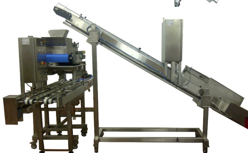
Solution complète Convoyeur d'alimentation + distributeur