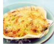
Coquilles St Jacques