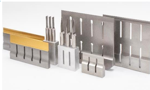
Lames en titane Profils différents selon applications