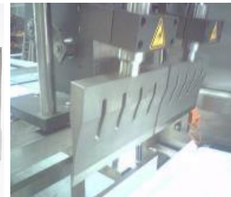
Guillotine Grande largeur