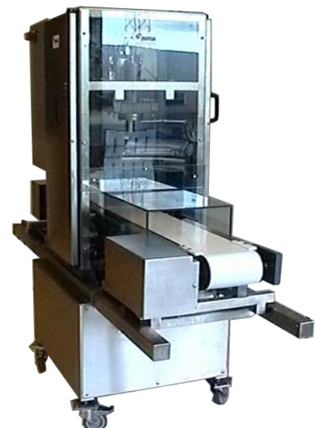
Unité de découpe Ultrason